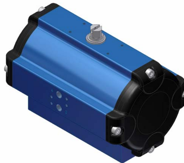
SAD - 135°

angewandte Norm : DIN EN ISO 5211, DIN EN 15714-3, VDI / VDE 3845, DIN 79