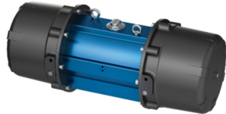
SADT / SADF